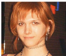
Victoria Francés AUTORA

“Con ‘Favole’ me desnudé sin querer ante el público”